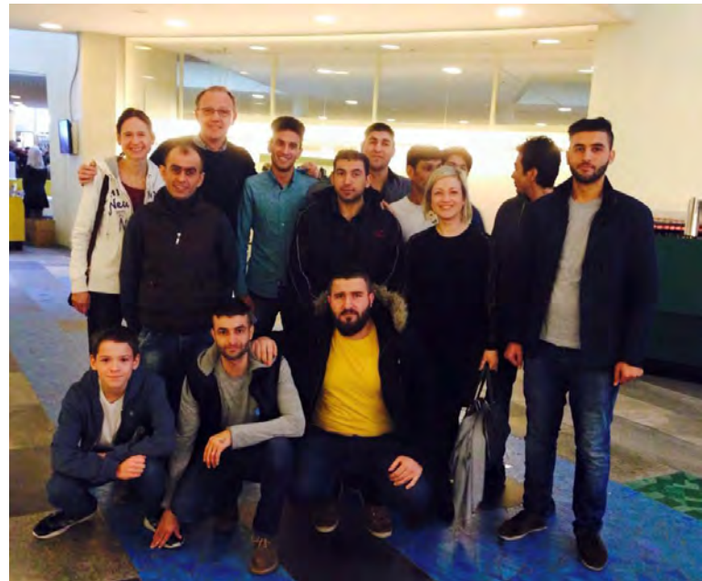
Gäste aus dem ICC und aus der Unterkunft in Neukölln mit ehrenamtlichen Helfer/-innen

Auch wir sagen Danke für einen großartigen Abend!